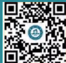
入学考试报名及预约